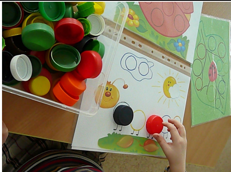
„Rask tinkamą dangtelį“ nuotrauka 3