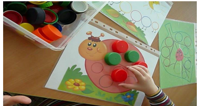
„Βρες το σωστό καπάκι“ Φωτογραφία 2