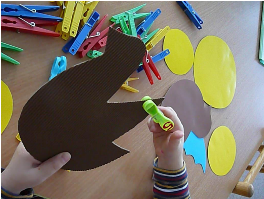
Εξάσκηση χεριού φωτογραφία 2